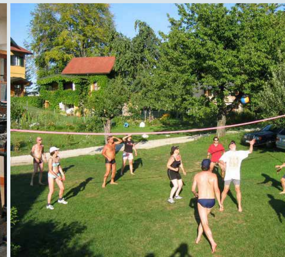
Волейбольные и футбольные площадки