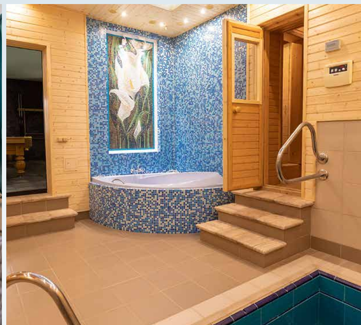
Баня, сауна, бассейн