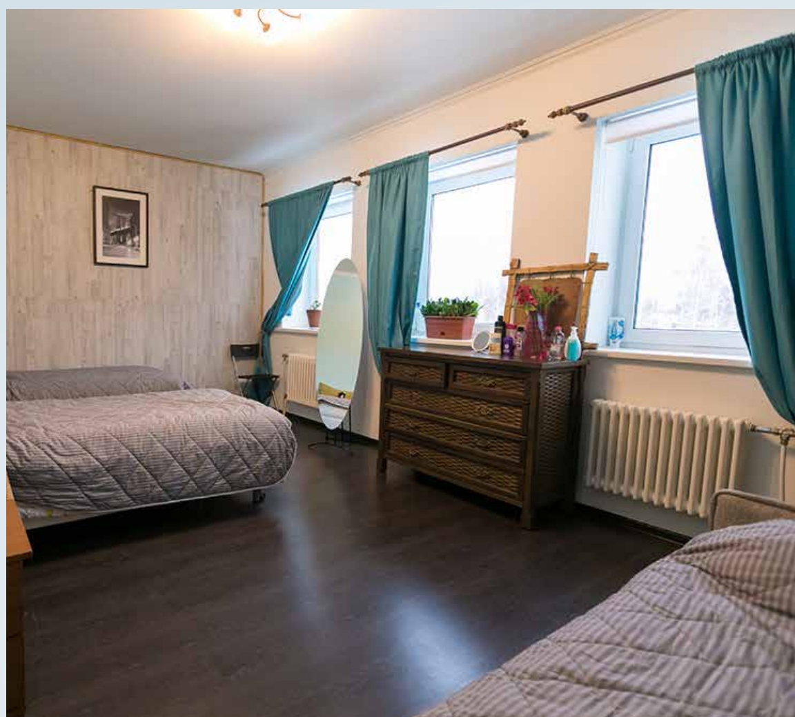
Комнаты по 3-5 человек (женские и мужские комнаты отдельно)